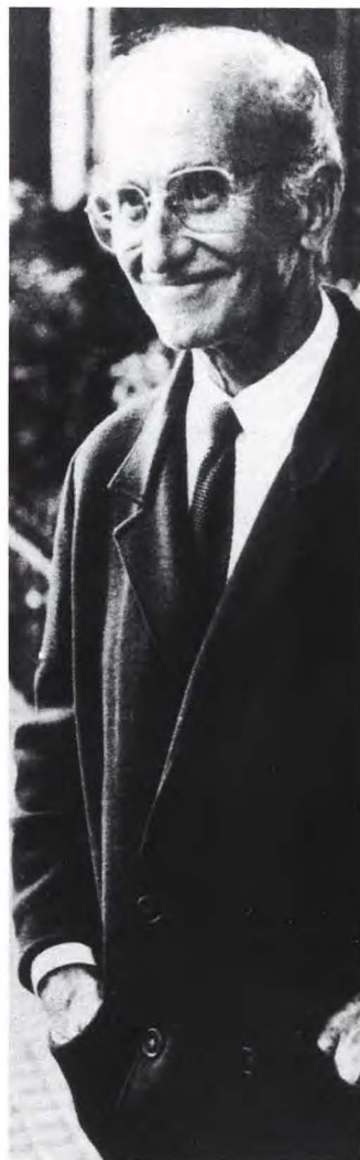
Alejandro de la Sota.

En las cuatro ediciones anteriores han sido galardonados los arquitectos Félix Candela, Julio Cano Lasso, Francisco Javier Sáenz de Oiza y Fernando Chueca.